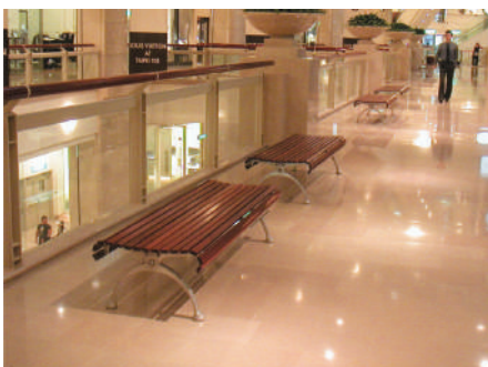
Taipei Financial Center - Taiwan