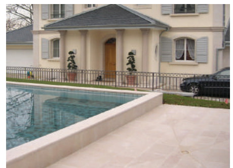
Villa - Genève - Suisse